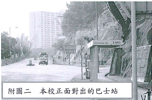
附圖二 本校正面對出的巴士站