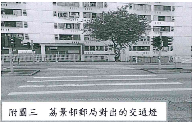
附圖三 荔景邨郵局對出的交通燈